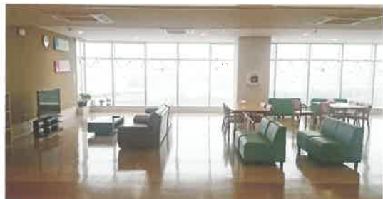
緩和病棟ラウンジ