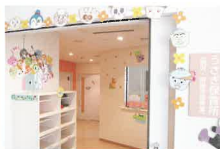
病児・病後児保育